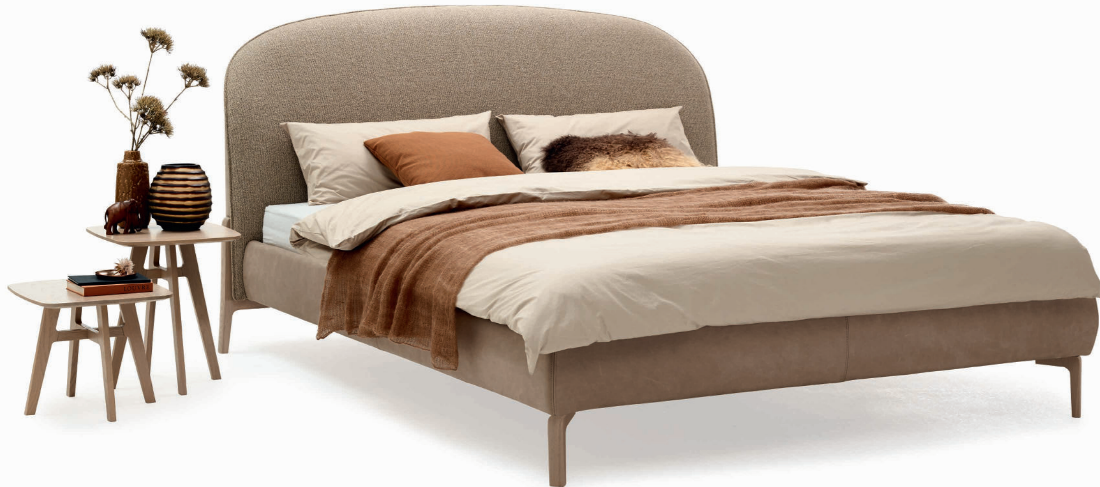
YVA mit Bettseiten in Leder Novara mushroom, Kopfteil in Stoff Moss 06 YVA with bed sides in leather Novara mushroom, headboard in fabric Moss 06

Soft, flowing forms characterise the elegant, yet contemporary look of the latest YVA bed by Hoffmann Kahleyss Design.